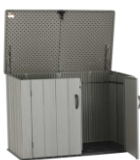
Ящик WOODLOOK 60212 2100л