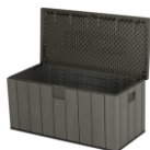
Сундук WOODLOOK 60215 570л